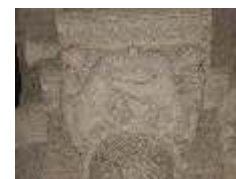
Loita de leóns.