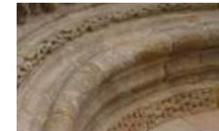
Boceis e mediascanas

A liña xaquelada e os adornos xeométricos simbolizan a luz divina, de xeito que eses motivos remiten á luz do Sol cuxos raios o iluminan todo. O “labrys”, labirinto, é un símbolo que o cristianismo relaciona con Cristo co machado, conveténdose nun icono precursor do sol nascente.