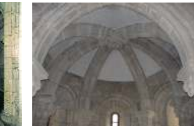
Bóveda de crucería nas ábsidas